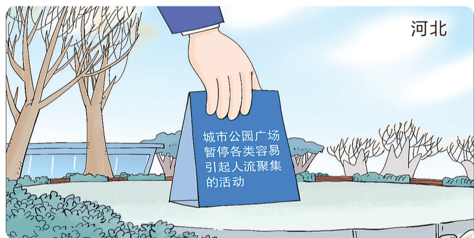
漫画:杜绝聚集

截至10日24时,河北省现有本地确诊病例265例(危重型1例、重型9例、普通型255例)、境外输入确诊病例2例(普通型)。累计治愈出院病例367例(含境外输入34例),累计死亡病例6例,累计报告本地确诊病例604例、境外输入病例36例。尚在医学观察本地无症状感染者203例、境外输入无症状感染者5例。