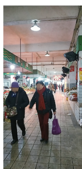
▲农贸市场里,买菜的市民大部分没戴口罩

记者从市商粮局了解,他们已经接到商务部办公厅的这份通知,并已经下发到各县市区商粮部门,要求督促辖区