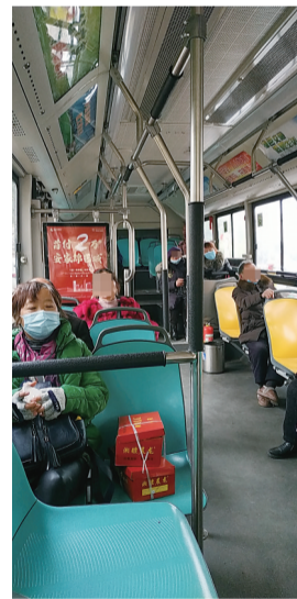
▲公交车上,一些乘客虽戴了口罩,却把口罩扯到了脖子上