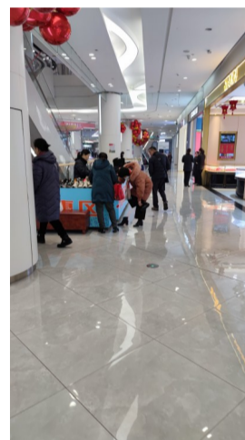
▲商场里,戴口罩的顾客少