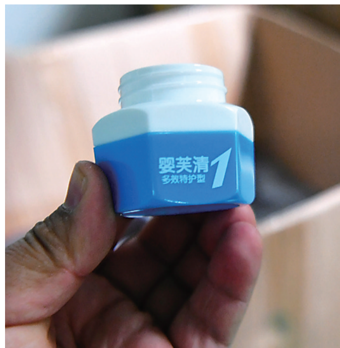
这是1月8日拍摄的福建欧艾婴童健康护理用品公司婴幼儿产品包装。

漳州方面回应称,当地已第一时间成立工作专班,对现场查见的留样样品、产品包装材料等进行取样留置,9日已联系厦门海关综合检验中心开展涉事产品激素含量检测工作,对于流入市面的产品,正持续跟踪下架召回进度,待寄回后同步进行检测,相关信息将及时公开。