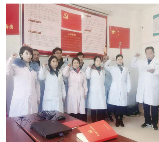
▲主题党日活动现场

本报讯(全媒体记者 杨如 通讯员 刘春香)为激发全体党员凝聚力、共同抗疫的热情，1月8日上午，宋家桥社区卫生服务中心党支部开展“抗疫表决心”主题党日活动。