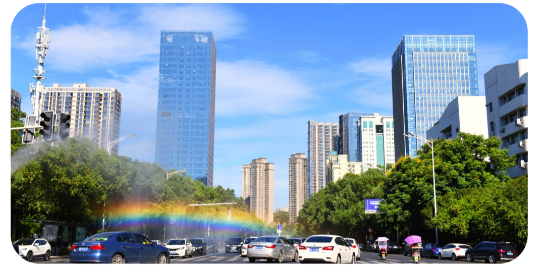
▲湛蓝的天空，街道上出现一道彩虹(资料图)