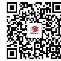
▲株洲晚报 老年大学微信公众号