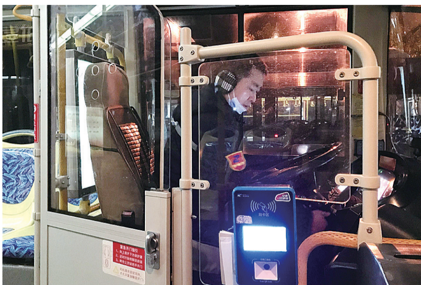
▲寒夜里,值班人员正在“热车”

伴着呼呼的北风,1月8日晚11点,株洲城区的气温达到“冰点”。大街上行人寥寥,但神农城北的公交调度站里还亮着灯、开着会。他们是公交发展营运一部的工作人员,他们要陪着公交车过夜。