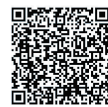
▲晚报乐活 周刊微信群