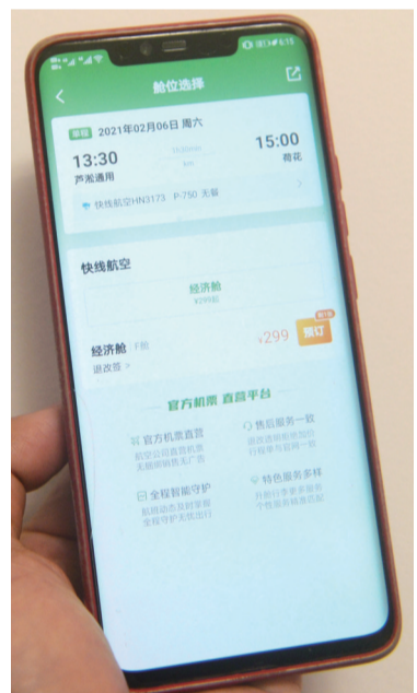
▲在手机APP上已可购票

工作人员也提醒,由于株洲至张家界航班为短途运输试运行阶段,航班执飞时间受天气、空军活动影响较大。乘客务必提前50