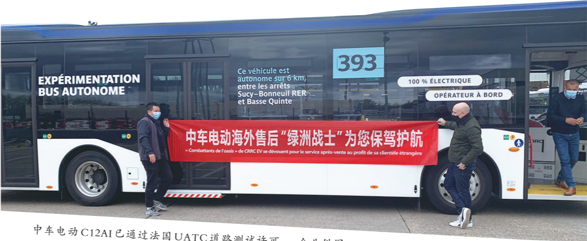
中车电动C12AI已通过法国UATC道路测试许可。