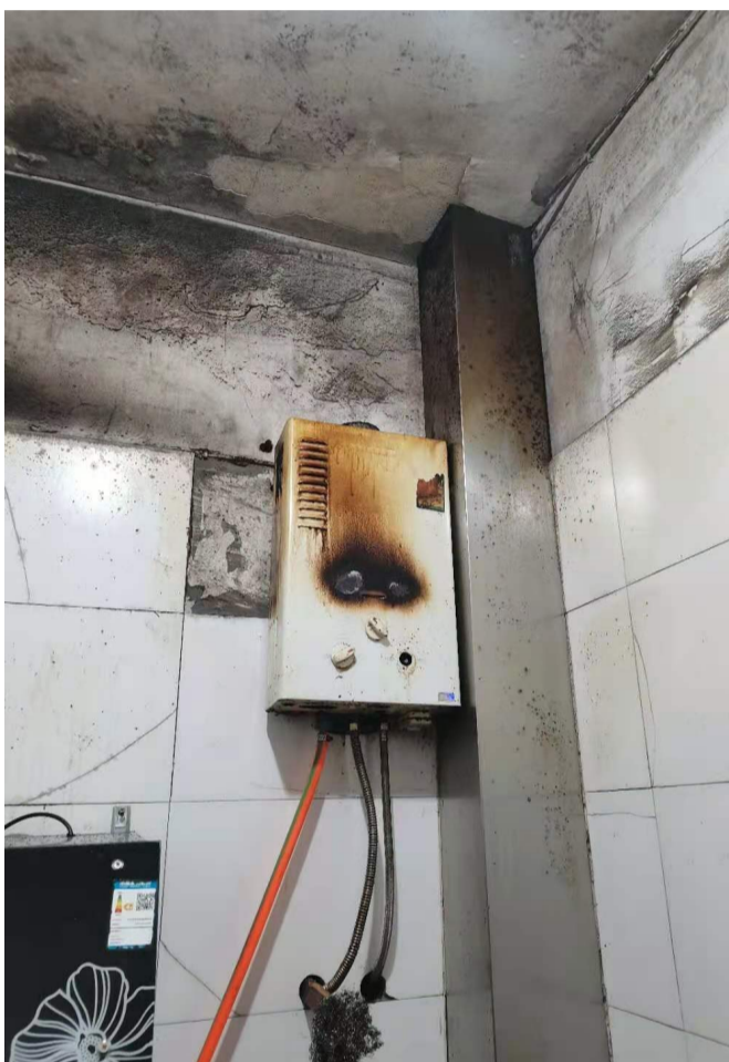
▲小乐家的热水器已老化,外壳已经被烧黑