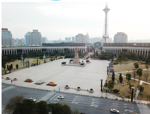
▲2020年2月4日,空旷的神农广场