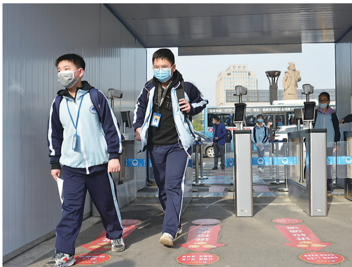
▲2020年4月13日,建宁中学,同学们戴着口罩走进校园