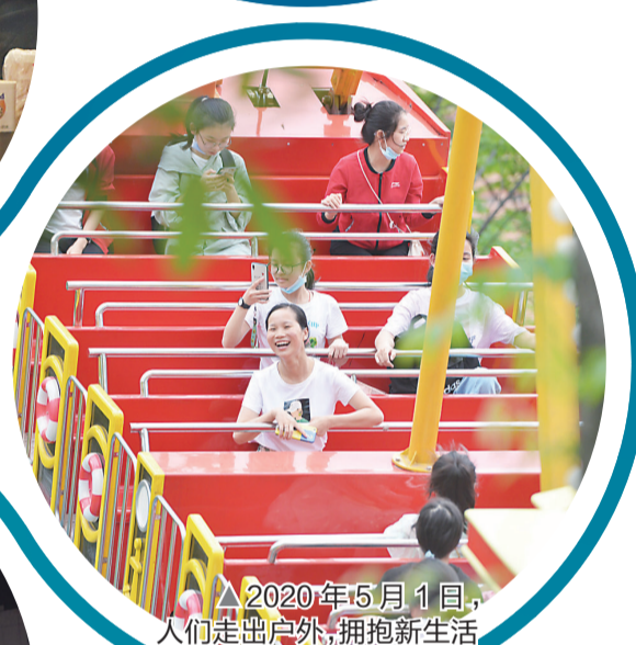
▲2020年5月11日,人们走出户外,拥抱新生活