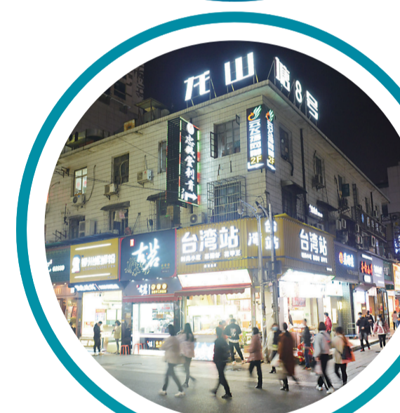
▲2020年4月,钟鼓岭夜市逐渐恢复人气