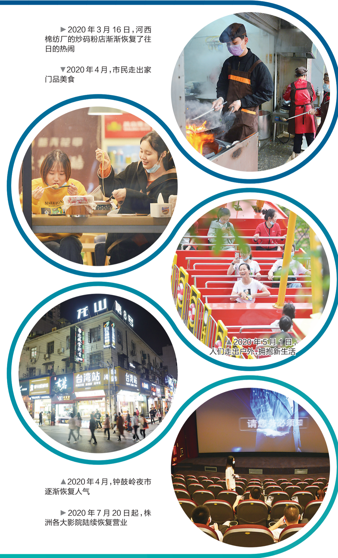
▶2020年3月16日,河西棉纺厂的炒码粉店渐渐恢复了往日的热闹