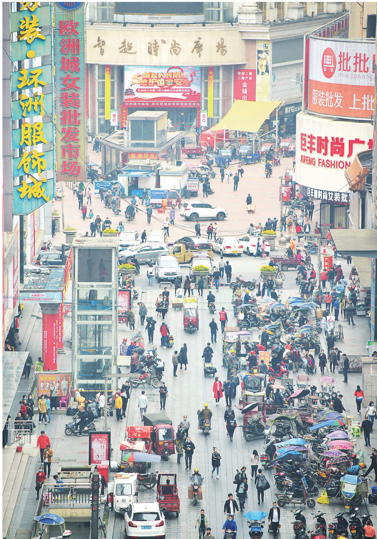
▲2020年4月,芦淞市场开始回暖