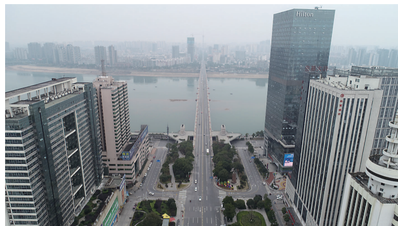
▲2020年2月1日,株洲大桥只有少量车通过

因为疫情,我们的城市仿佛被按下暂停键,曾经热闹的钟鼓岭夜市、繁忙的芦淞市场群、人来人往的农贸市场,一下子冷清得让人觉得陌生。然而春天总会到来,有了大家齐心协力、共同抗疫,这样陌生的场景并没有停留得太久,城市很快就在醉人的烟火中迎来新生。