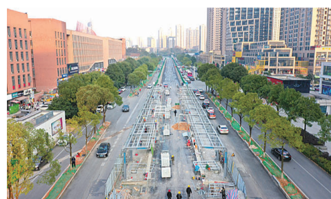
▲2020年12月21日,智轨工业大学站建设现场