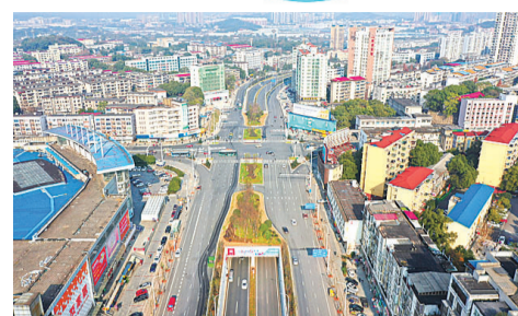
▲2020年9月29日,响石广场改造工程正式竣工并举行通车仪式