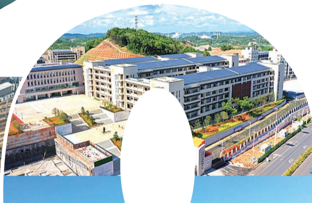
▼2020年9月长郡云龙实验学校等八所中小学开学