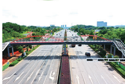
▲2020年8月28日,改造后的云龙大道(洞株路株洲段)全线通车