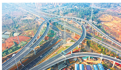
▲2020年12月25日,北环大道与长株高速交汇处