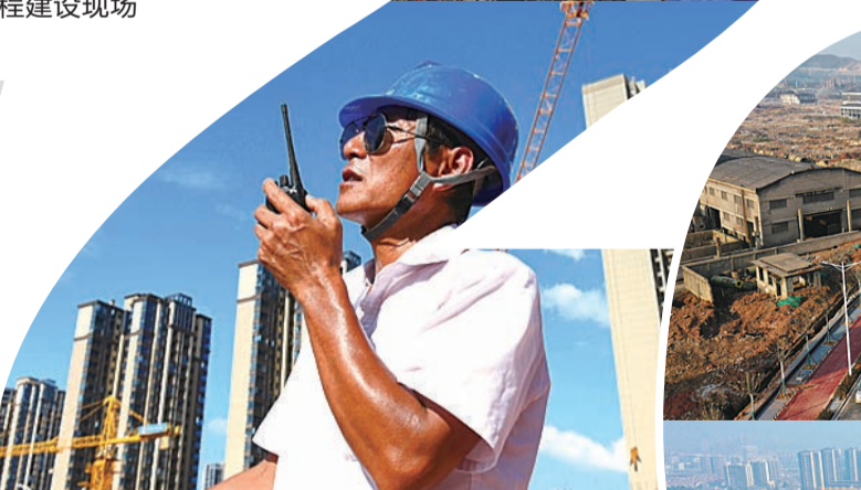
▲城市的发展离不开这些辛勤的建设者