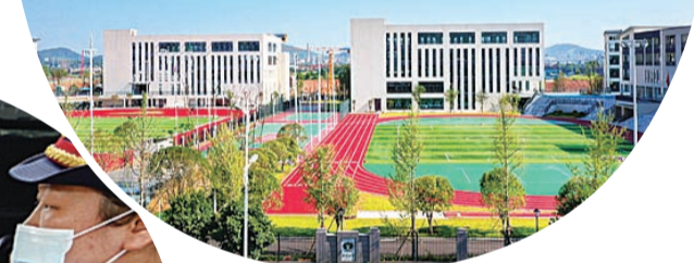
▲2020年9月隆兴小学、隆兴中学等八所中小学建成开学