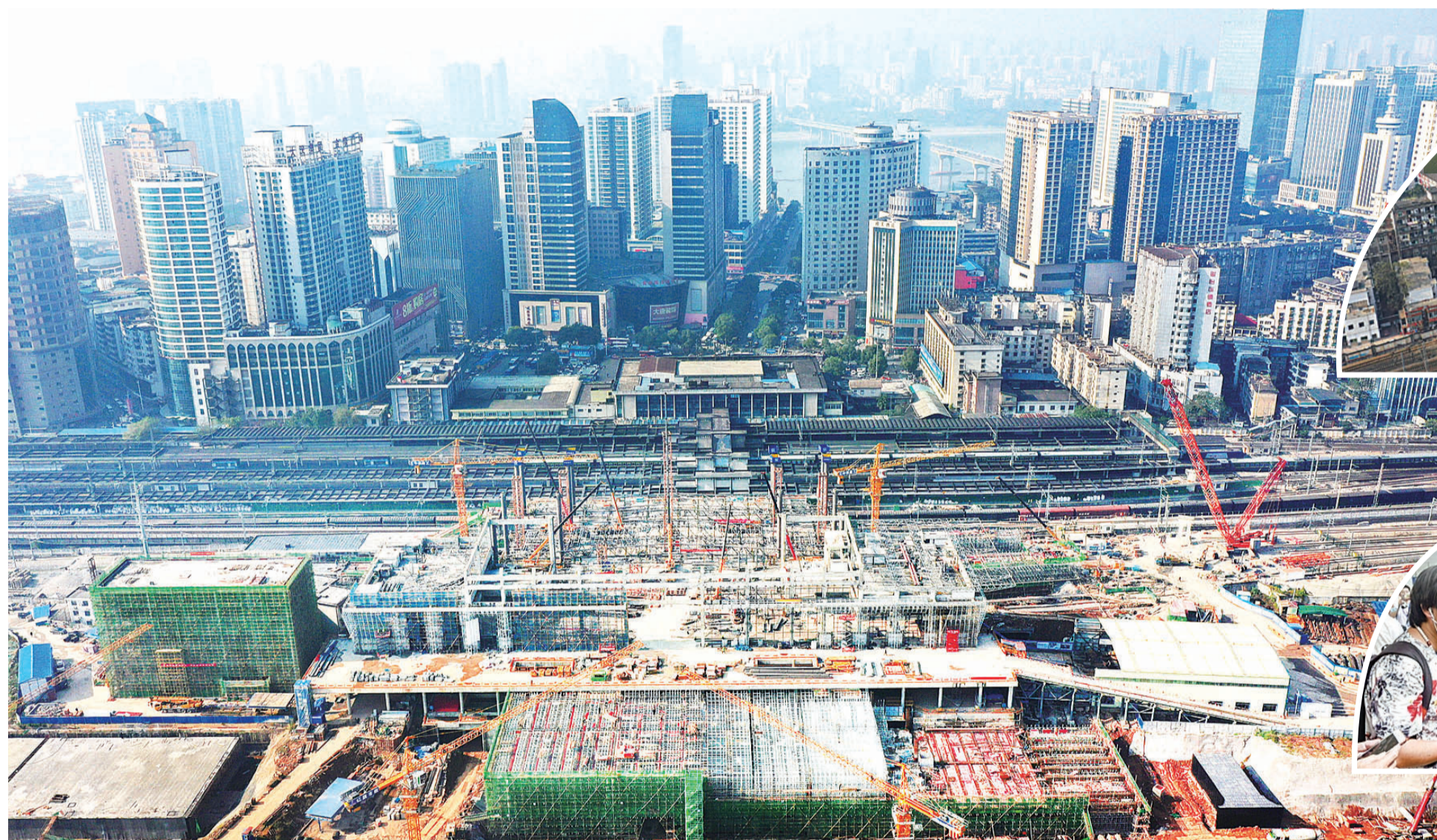
▲2020年12月22日,株洲站改扩建工程建设现场