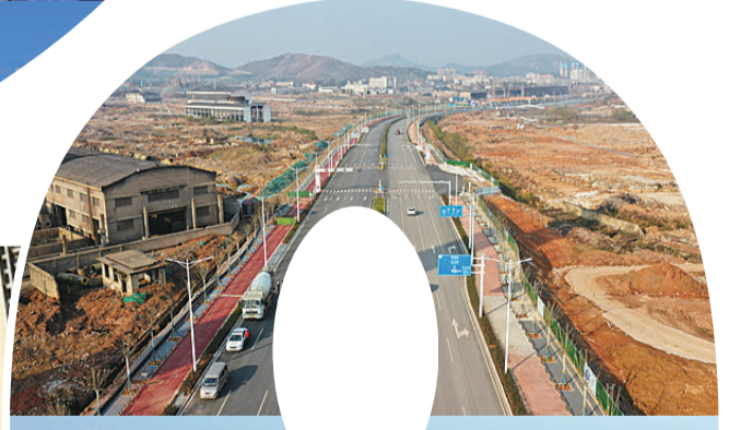
▼2020年10月1日,清水塘大道正式开放通车