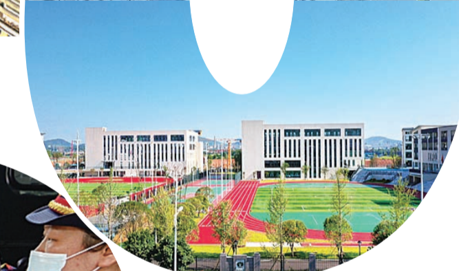
▲2020年9月隆兴小学、隆兴中学等八所中小学建成开学