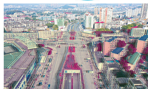
▲2020年9月29日,响石广场改造工程正式竣工并举行通车仪式