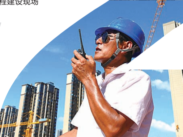
▶2020年12月22日,建设中的万达广场