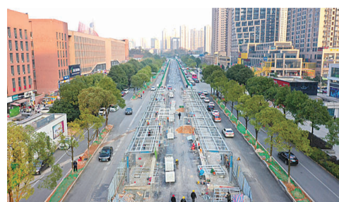
▲2020年12月21日,智轨工业大学站建设现场