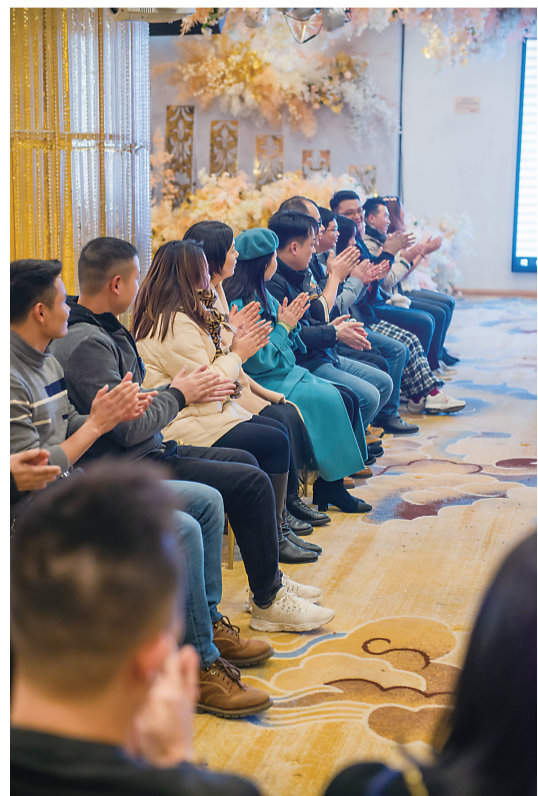
▲幸福能力测试:一分钟内鼓掌次数越多,幸福能力越强