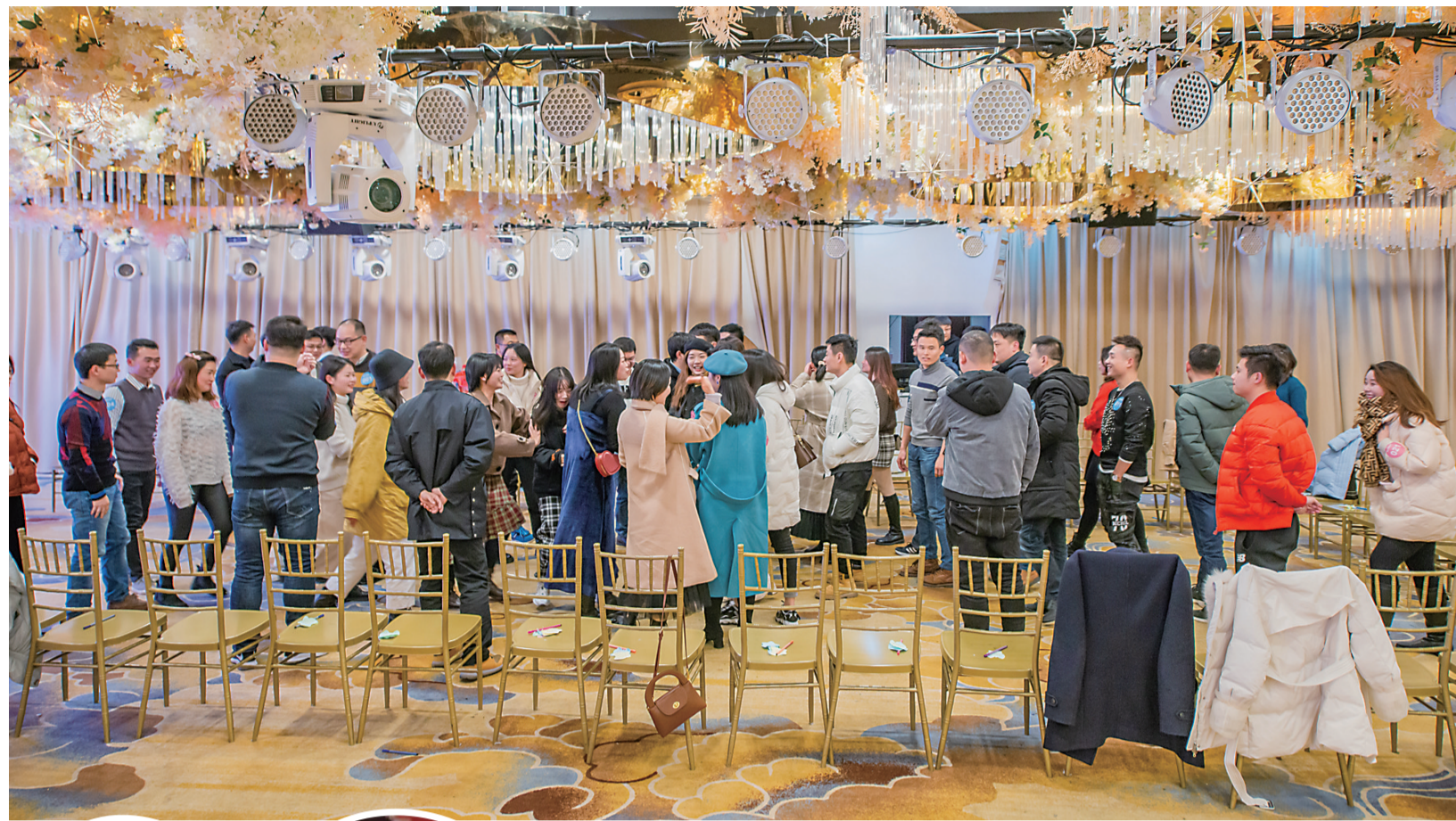
▲现场跟5个以上异性打招呼,并介绍自己