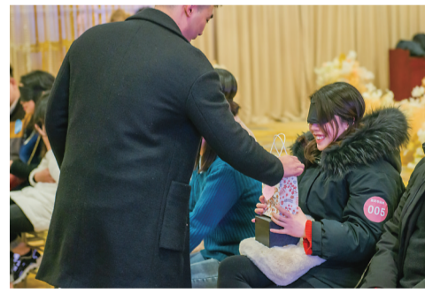
▲戴上眼罩,互赠礼物