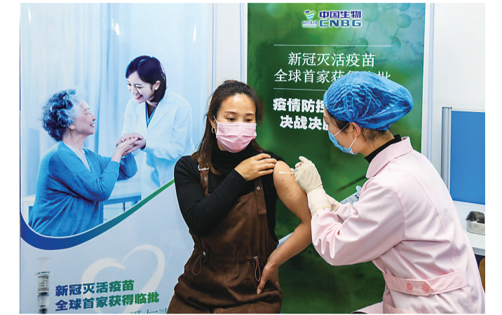
▲去年4月12日,第一位志愿者在河南省焦作市武陟县疾病预防控制中心,接种由国药集团中国生物武汉生物制品研究所研制的新型冠状病毒灭活疫苗