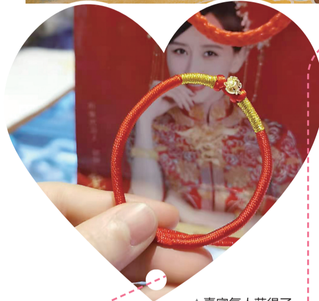
▲嘉宾每人获得了一份伴手礼(由龙凤珠宝免费赞助)