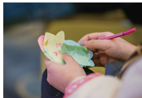
▲给TA的标签。女嘉宾正在写出他自己的印象