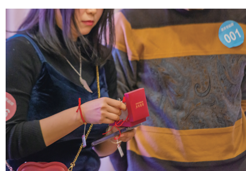
▲互选成功的嘉宾获得一对银吊坠(龙凤珠宝提供)