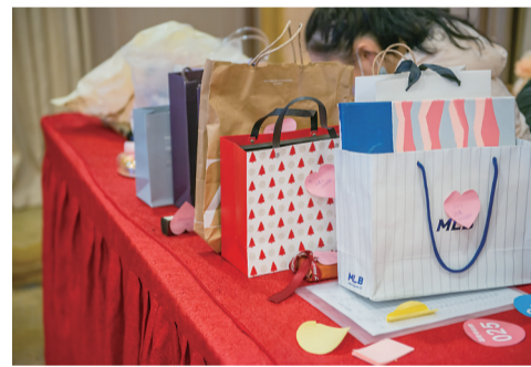
▲嘉宾各自精心准备的小礼物