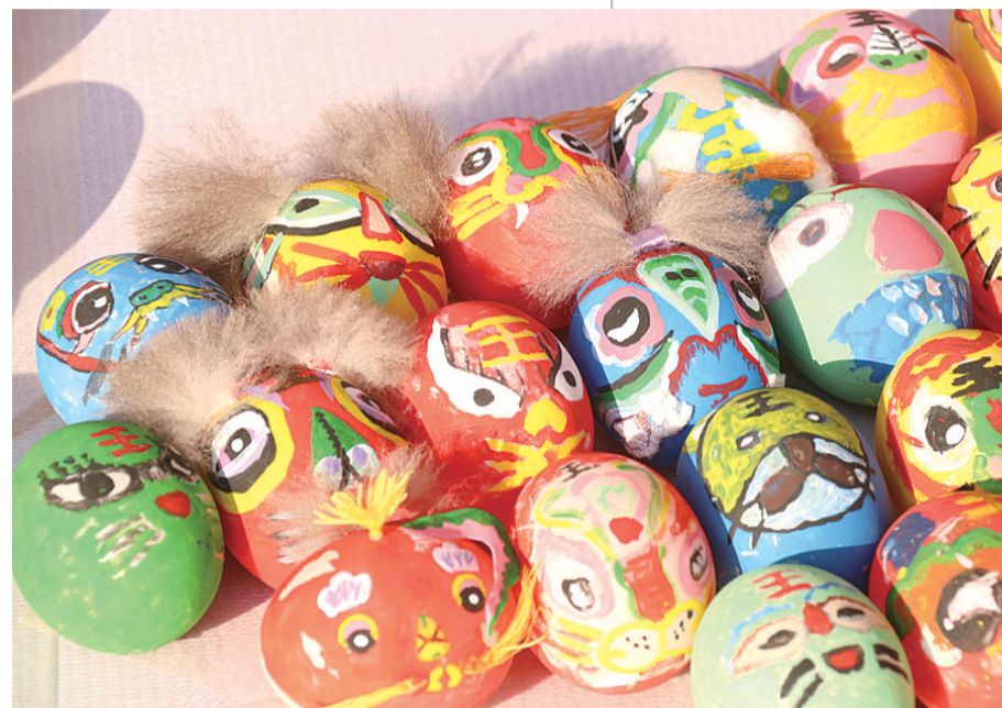
▲ 凿石小学画“圆蛋”

HDVC是高压直流输电的简称。HVDC晶闸管器件是高压直流输电相控换流阀中的核心部件,换流阀决定了直流输电工程的最大通流能力和运行电压,而晶闸管的容量直接决定换流阀的综合性能。作为中车株洲所旗下株洲中车时代电气股份有限公司的核心子公司,时