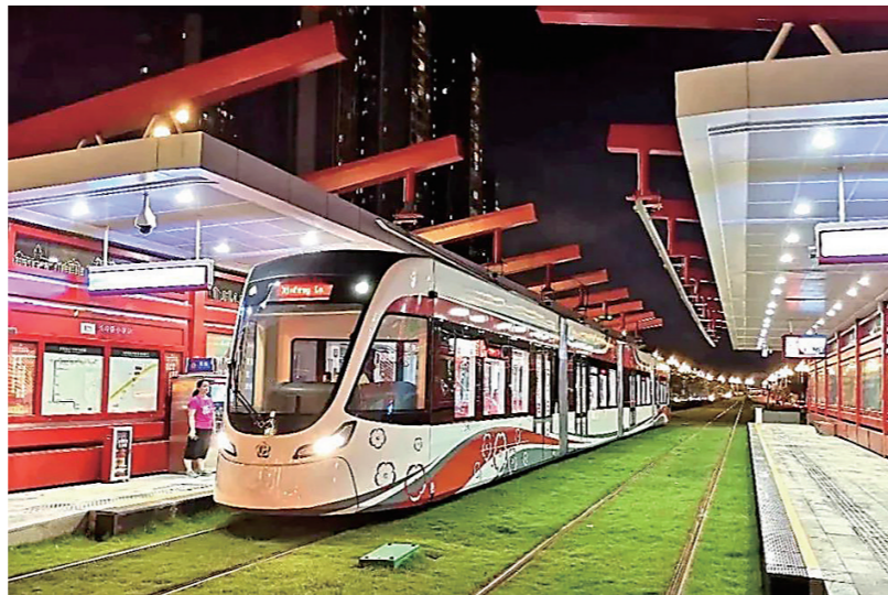
广州黄埔有轨电车。