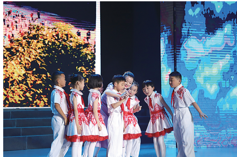
▲八达小学60周年校庆,师生将校园故事搬上大舞台

本报讯(记者 何春林 通讯员 邓念)前日下午,荷塘区八达小学师生举行了60周年校庆文艺汇演。