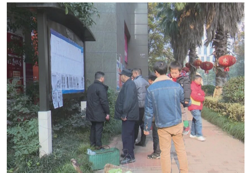
▲小区布告栏前,居民们在议论纷纷