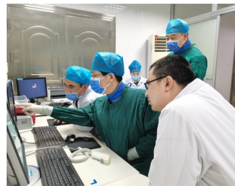
▲团队讨论患者病情

在省直中医院,有这样一群默默坚守在黑白影像背后的白衣战士,以实际行动诠释着医学影像科战士的责任和担当。