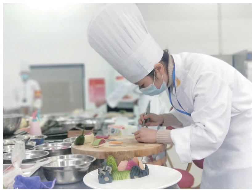
▲2021年度湖南省职业院校技能竞赛中职烹饪赛现场

本报讯(记者 何春林 通讯员 刘元)近日,2021年度湖南省职业院校技能竞赛中职烹饪赛项在我市举行。