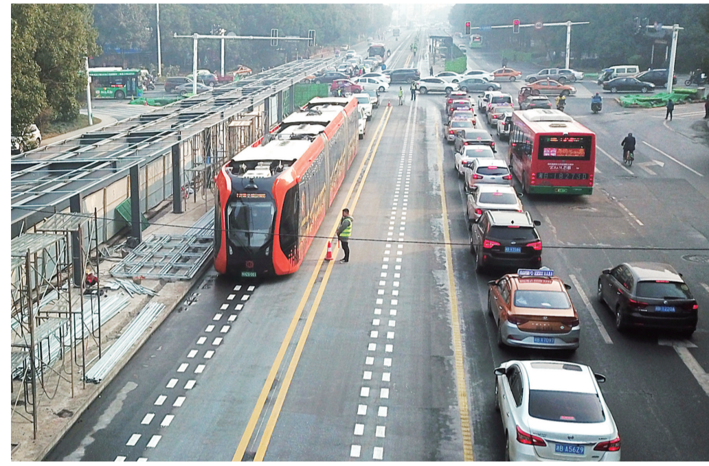
▲智轨电车在黄河南路西站进行停靠测试

本报讯(首席记者 戴凇 通讯员 夏四亮)昨日上午,智轨一期工程河西段启动上线试跑,经过40分钟的运行,首次试跑圆满完成,标志着智轨一期工程建设取得阶段性成果。