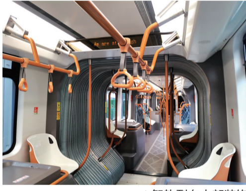
▲智轨列车内部装饰

市交通运输局相关负责人介绍,按照总体规划,智轨一期工程将全面开展建设攻坚和运营筹备攻坚两大战役,力争早日以崭新的形象