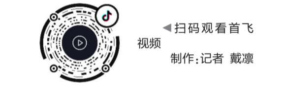
▲扫码观看首飞视频 制作:记者 戴凇