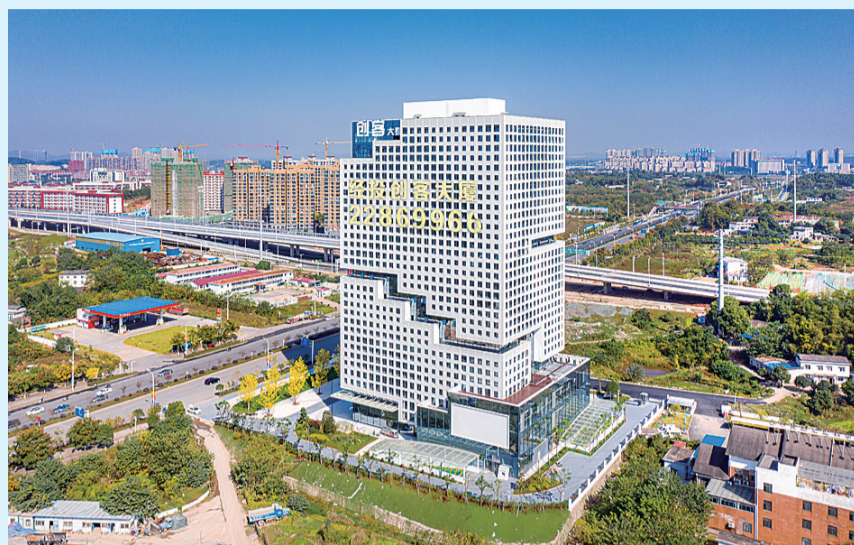
▲ 云龙创客大厦

“云龙的交通区位优势和产业孵化培育链,让企业发展有更好的先天优势。”四处寻找项目落脚点的灵云智慧信息科技有限公司团队,在与株洲经开区、云龙示范区进行首次项目对接洽谈中,便爱上了这片热土。项目一次性投资5000万元,并签订了三年落户合作协议,入住该区创客大厦。