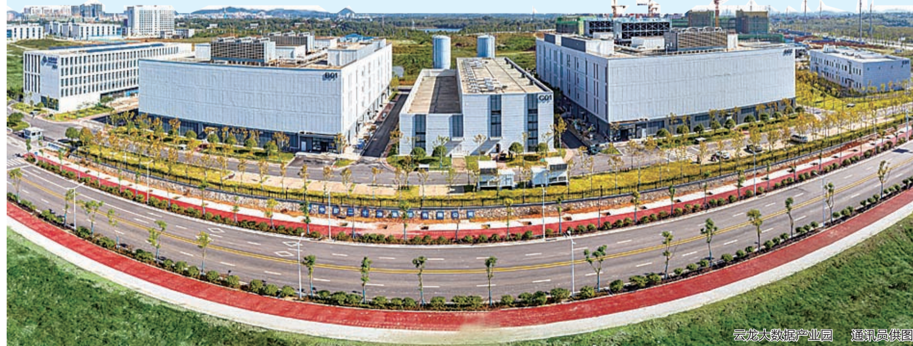
▲ 云龙大数据产业园