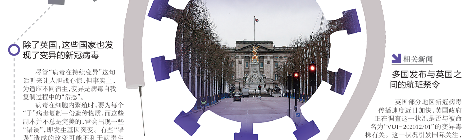
▲12月21日,英国伦敦白金汉宫前的林荫道行人寥寥

“新变异毒株传染力激增”“英国升级疫情防控”……自新冠疫情暴发以来,病毒进化始终是人们关注的焦点,而英国最新报告的新冠病毒变异,更引发公众担忧。 那么,应如何看待新冠病毒变异?英国这次报告的变异病毒是否具有更强的致病性及致命性?疫苗会不会就此失效?