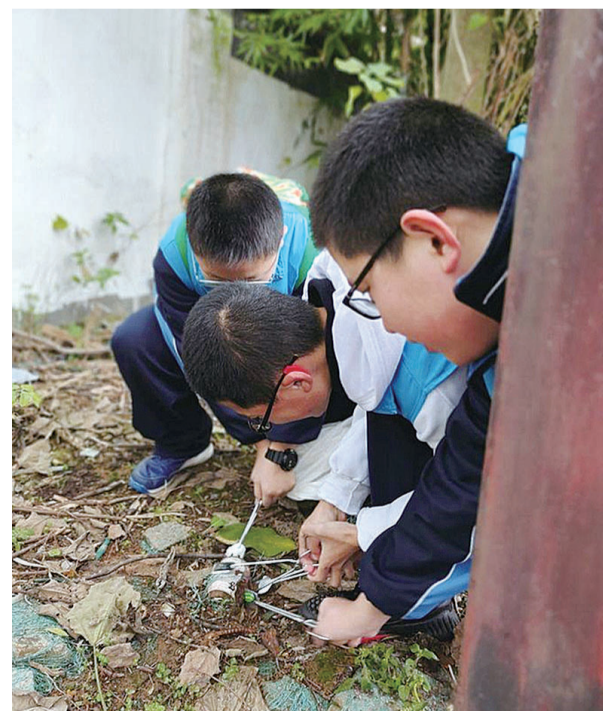
▲有的垃圾深陷在泥巴里,同学们齐心协力、耐心清理