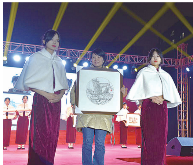
▲该校第二届学生作品模拟拍卖会上,竞拍得主与作品合影