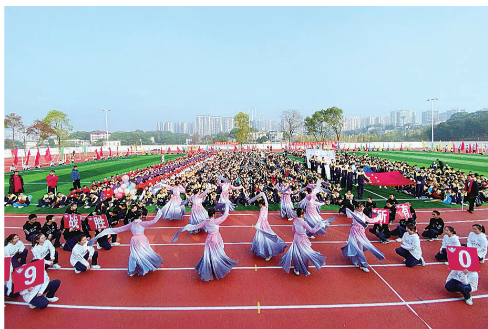
▲初二年级1909班入场秀