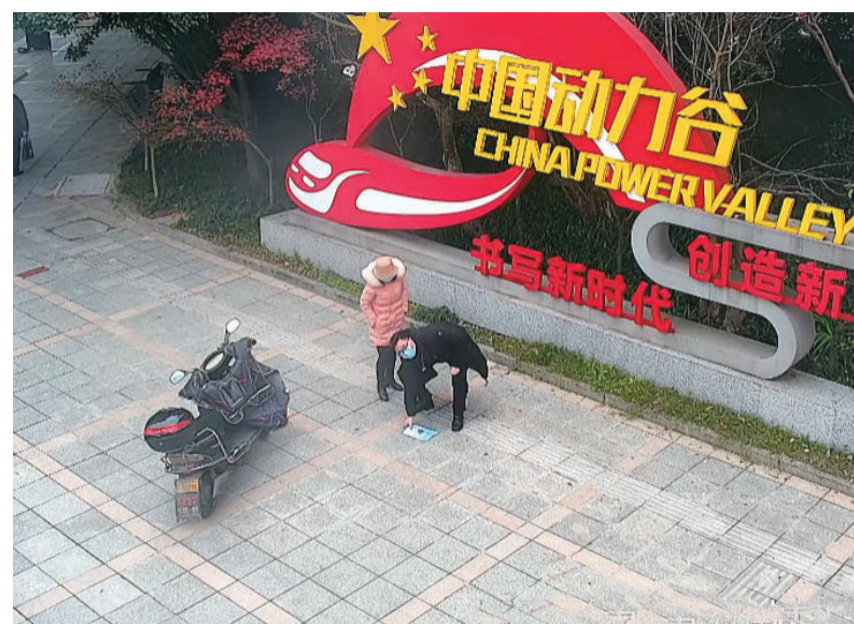
▲听到坐席员的劝导,一位市民捡起此前扔在地上的宣传单(视频截图) 通讯员 供图