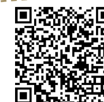
▲扫码看采访视频 视频制作: 谢慧