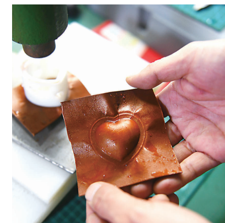
▲通过机器压制出有质感的形状