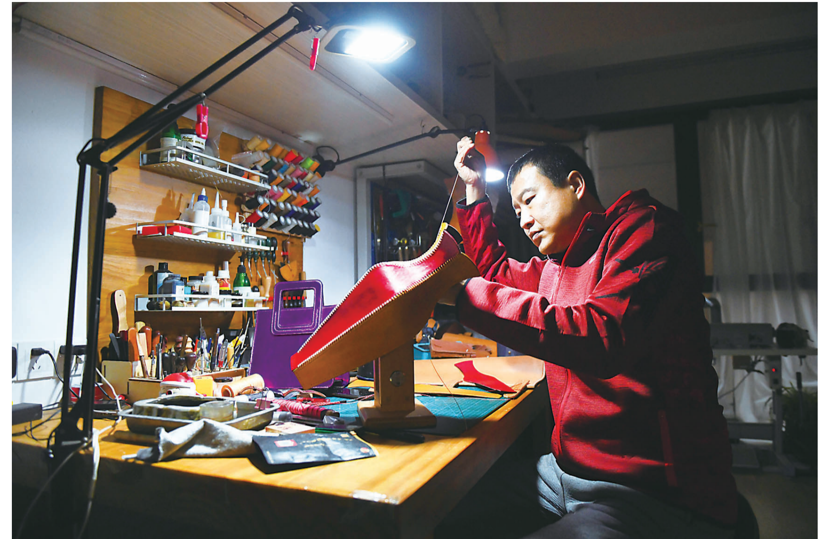
▲灵感迸发时, 周至越做越有味