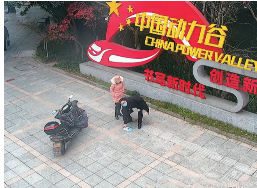
▲听到坐席员的劝导,一位市民捡起此前扔在地上的宣传单(视频截图)