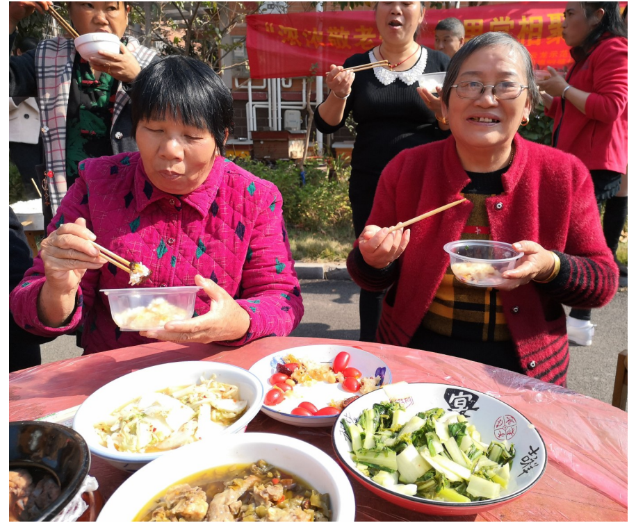
社区百家宴,邻里笑开怀。

提高保障标准,惠及各类困难人群。今年,该区累计发放社会救助金298万元,救助困难群众5796人次。目前,城市、农村低保月人均救助水平达到504.23元和367.70元,排在全市前列。特困人员生活补贴标准提高至9360元/年/人,护理费标准根据自理、半自理、全护理分别提高至221元/月/人、369元/月/人、737元/月/人。此外,该区还为辖区1676名残疾人购买意外保险,为636名重度残疾人购买城乡居民基本医疗保险,为313名残疾人购买城乡居民养老保险。