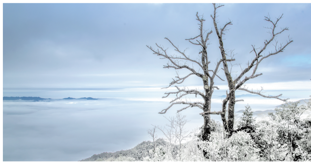
旅游环线石洲将军山路段,大雪纷飞的日子里,云海也如约而至。

炎陵观看云海最佳地点为炎帝陵对面夹石坳顶端,还有云上大院和旅游环线石洲将军山至策源良桥路段。