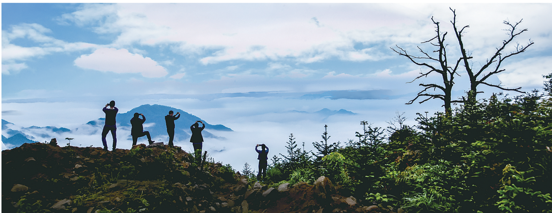
旅游环线石洲将军山路段,你拍,我拍,大家拍,这仙境谁不喜欢。