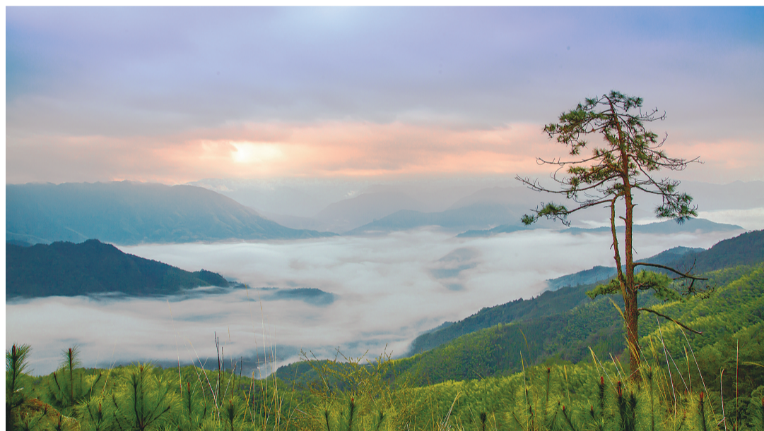
策源梁桥秧田坳,朝霞,云海,松树和谐的融为一体。