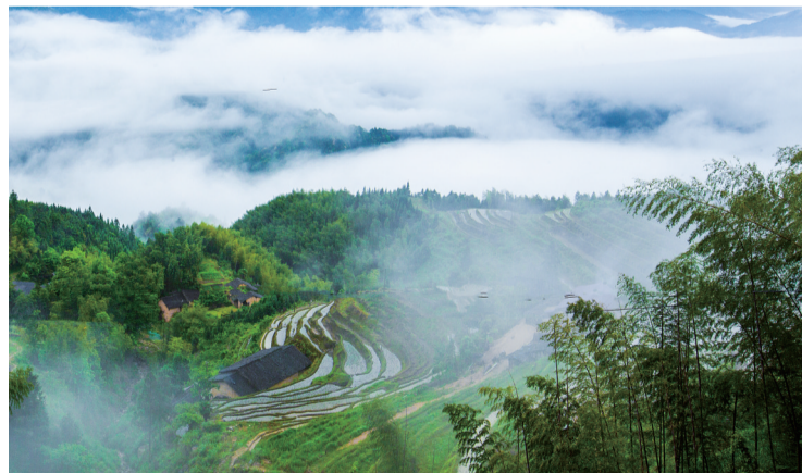
旅游环线策源梁桥冬芽坳路段,初春时节,云雾如同薄纱在山中漂浮。