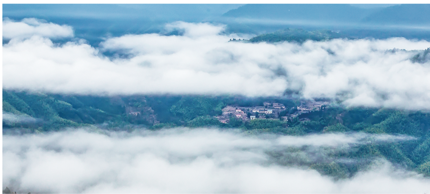
炎陵策源梁桥,大山深处的民居,透过云海,若隐若现。