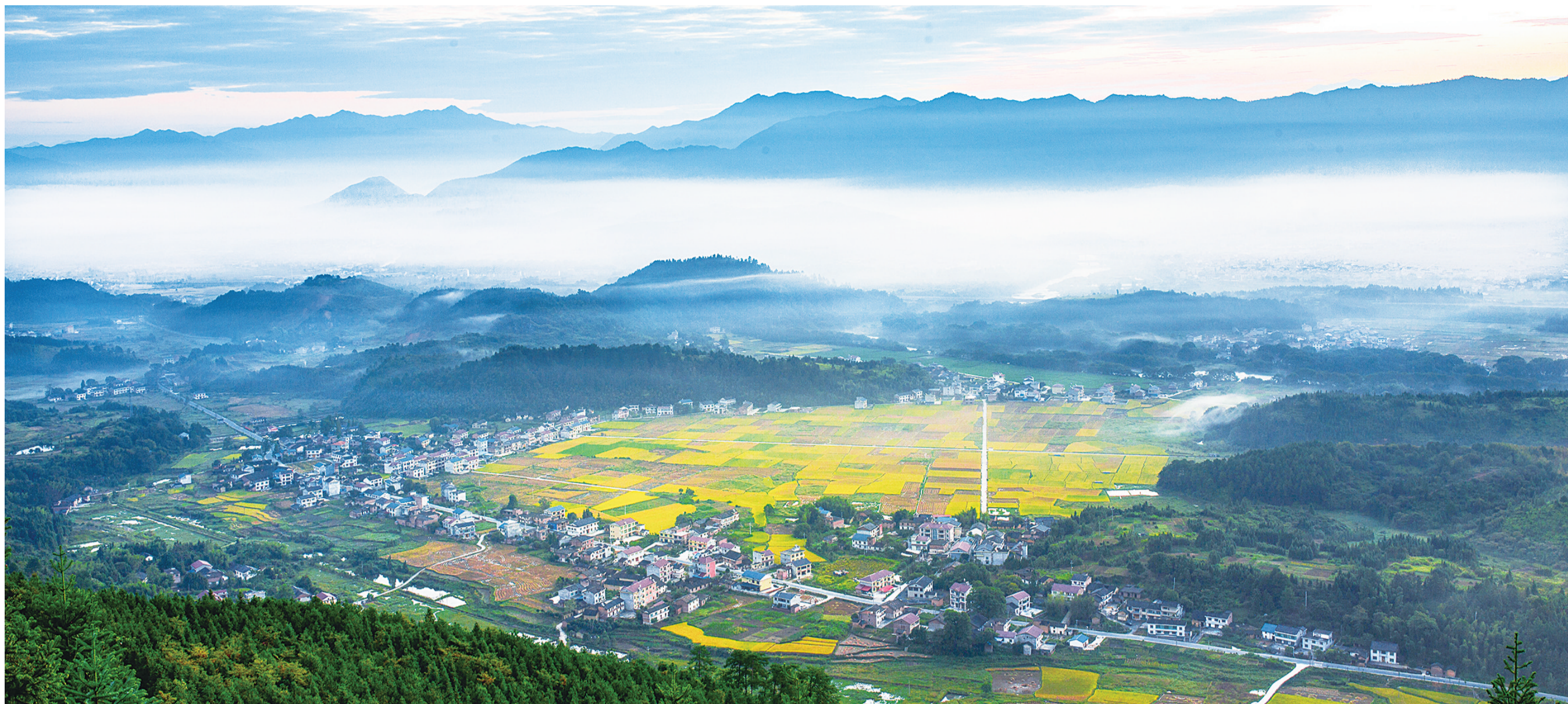
炎陵鹿原夹石坳,金秋的云海似玉带一般飘浮在山腰之间。