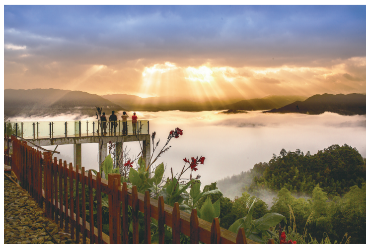
炎陵策源远山蓝民宿,圣光从天而降,照射在民宿上如同仙境一般。