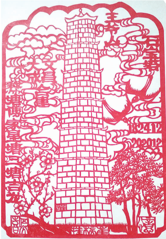
剪纸作品(作者:伍芬喜)