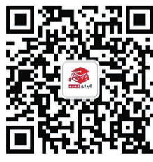
▲株洲晚报老年大学微信公众号