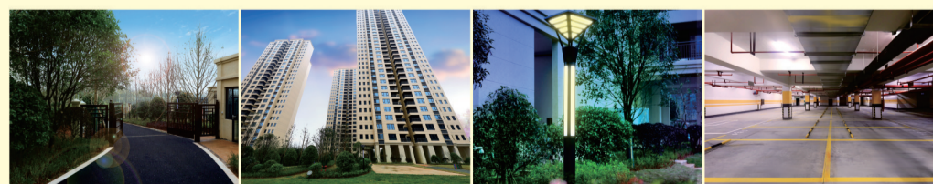
西郡一期实景拍摄