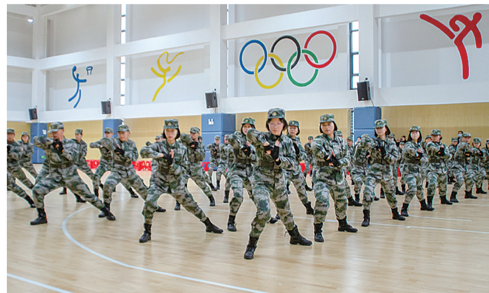
▲国防班的同学在表演军体操

本报讯(记者 何春林 通讯员 邓志刚)14 日下午，我市首批设立的高中国防教育特色班(简称国防班)授旗授衔仪式在市一中举行。当日下午，在嘹亮的国歌声后，芦淞区人武部授予市一中国防班班旗、株洲军分区、市教育局相关负责人为同学们授予臂章。为提高青少年国防素质、国防意识和忧患意识，促进学生的健康成长，推进学校特色发展。经市教育局同意，市一中在 2020 级新生中开设了两个国防班，每班 54 名学生。什么样的学生可以进入国防班就读？市一中相关负责人介绍，除了中考成绩达到学校录取标准外，学生要自愿申请，家长要