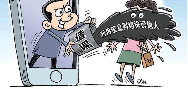
漫画:“泼脏水”徐骏 作