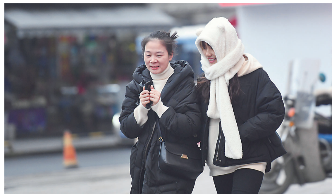
▲12月15日下午,车站路,刚从室内走出来的市民,外面的寒风让她们直打哆嗦