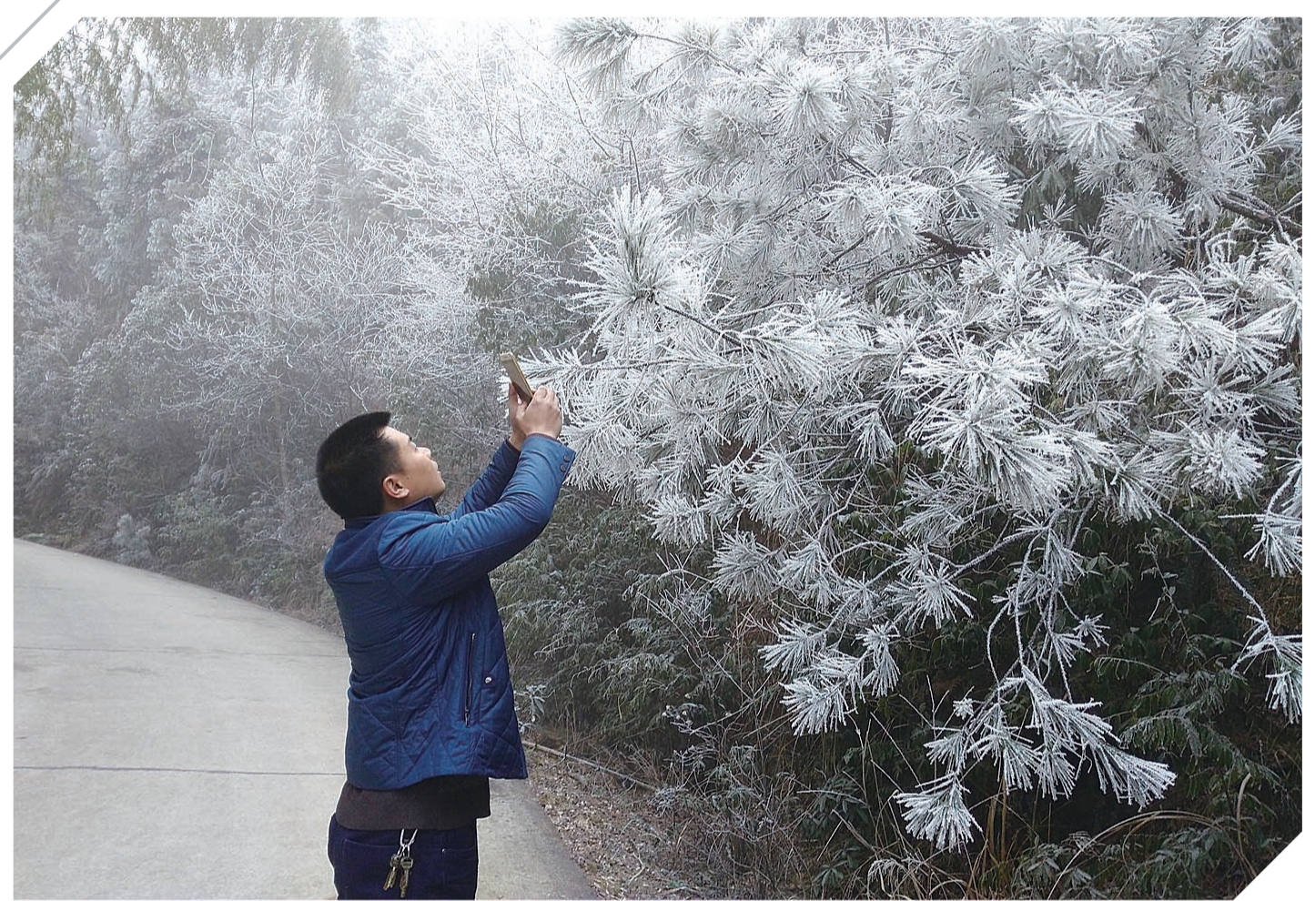
▲大院农场,雾凇景观将游客带入冰雪童话世界