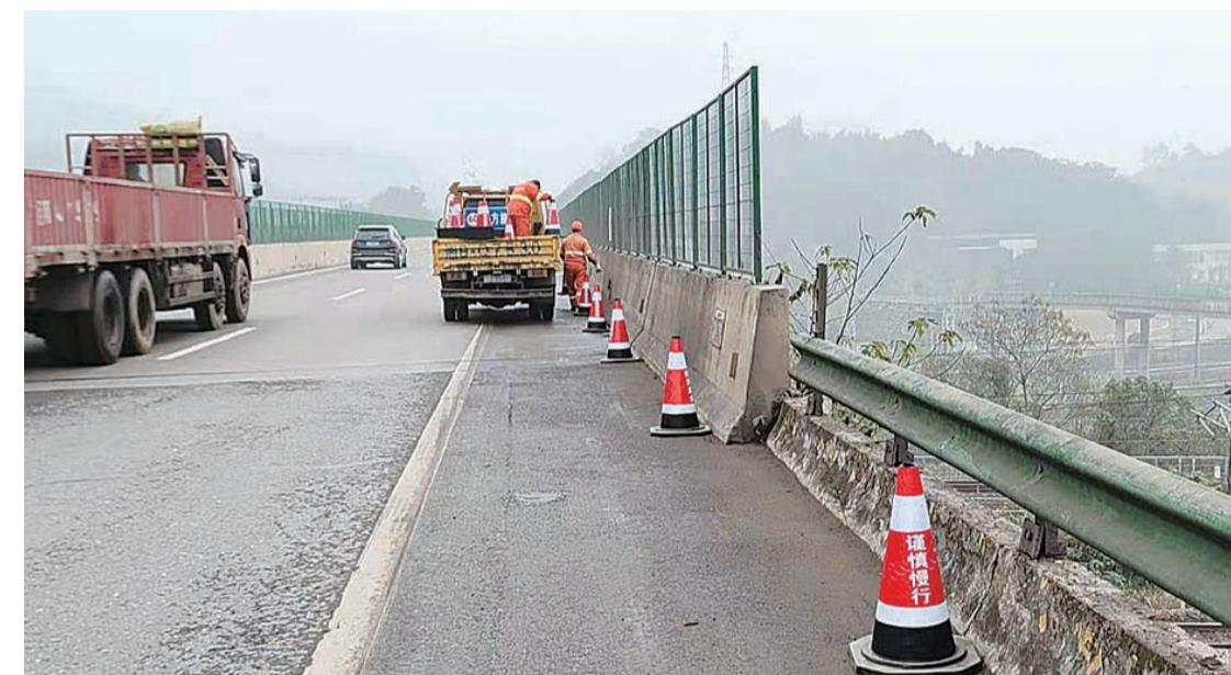
▲白关养护所辖区桥梁、通道处摆放安全锥筒

本报讯(记者 刘玺 通讯员 龚勋 赵雅静)记者昨日从省高速公路集团株洲分公司获悉,为应对低温雨雪冰冻天气,该公司积极组织各养护所提前部署,积极备战,切实做好抗冰保畅前期准备工作。