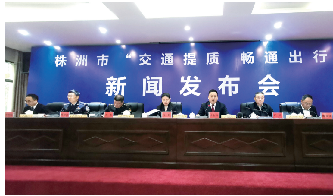
▲新闻发布会现场,各部门相关负责人现场答疑解惑

同时,随着城市现代化步伐的加快,车辆越来越多,新华桥成为我市东西交通要道的交通瓶颈,有必要对它进行改造,这是现实所需。新华桥拆除重建,将消除危桥隐患,提高车道数量,减少现有树木对交通通行影响,消除现有新华桥交通瓶颈,提升通行效率。