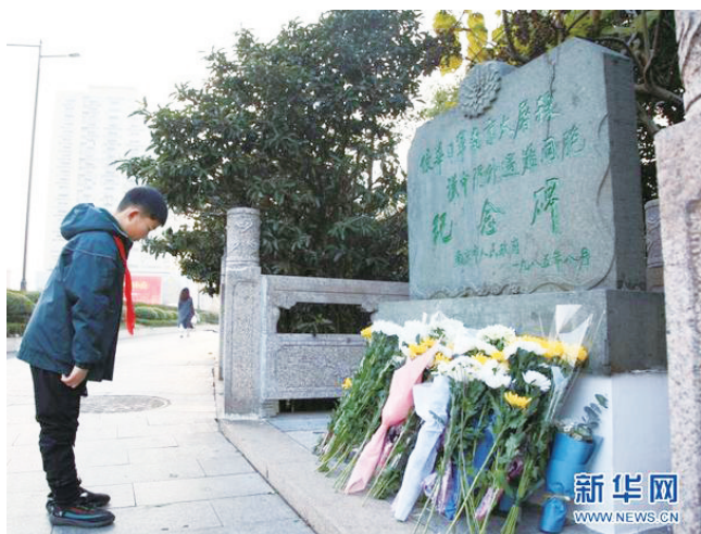
一名小学生在侵华日军南京大屠杀遇难同胞纪念馆前鞠躬。