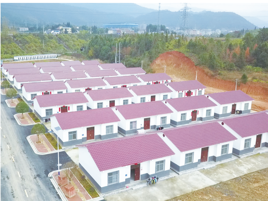
易地扶贫搬迁集中安置区。

在安置房建设中,该县采取统规统建、统规自建等办法,让群众有一定的选择余地,政府给予一定的经济补助。对于购买商