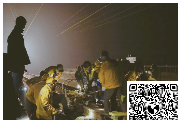
顶着夜间寒风,施工人员在更换铁轨。