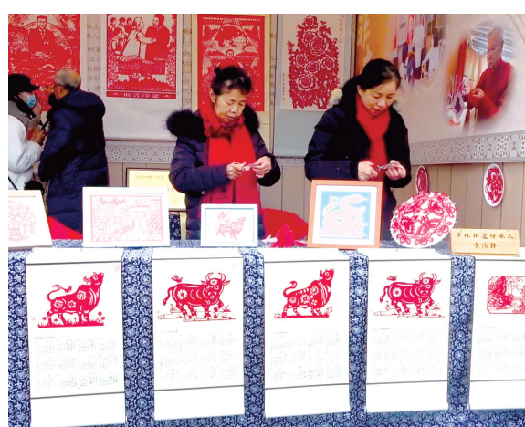
非遗项目传承人在表演剪纸技艺。

文旅融合,炫彩非遗。12月11日,株洲市首届非遗博览会、长株潭非遗产品展示展销会暨株洲市第二届文化创意大赛颁奖仪式,在株洲市博物馆举行。 视频、图片、文字/火龙果视频