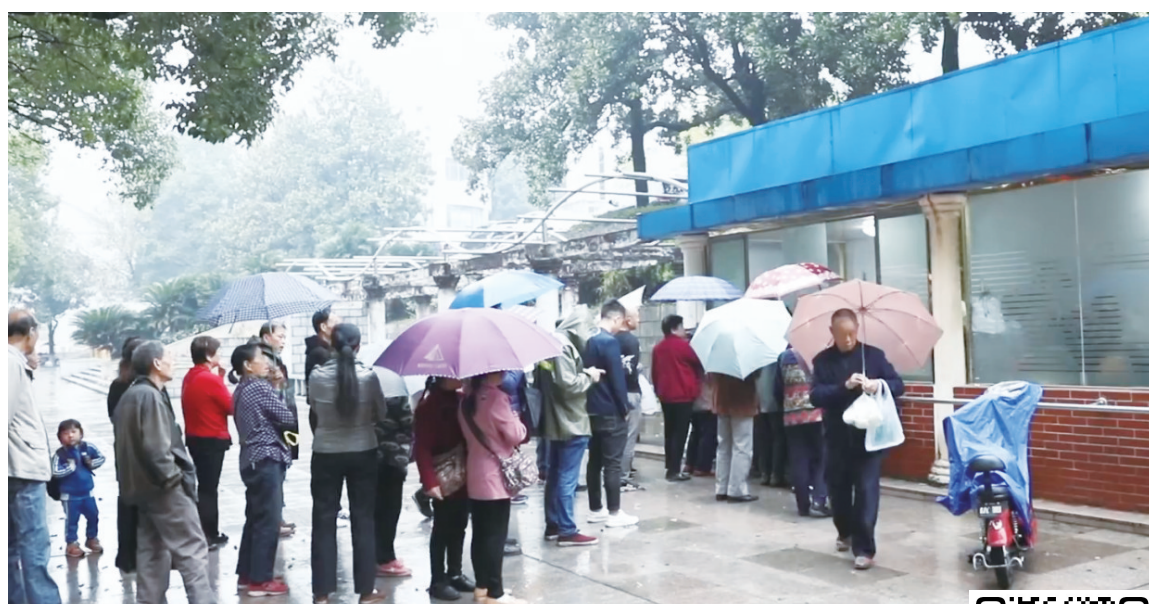
每天,在包子铺前购买包子的人们。

在株洲硬质合金集团有限公司,有这样一家包子铺,它没有门头招牌,却远近闻名,人们习惯把它称为“601包子”。60多年来,包子铺里的师傅更换了几代人,但包子的味道却从未变过。每天开门营业前,新老客户会络绎不绝的来到这里,静静地等待,等待那份属于记忆的味道。观看视频,跟随《味道株洲》一同了解“601包子”。