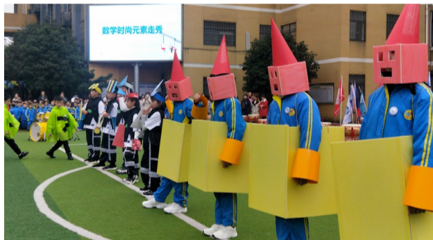
▲同学们用废旧物品组装成各种立体几何

本报讯(记者 何春林 通讯员 李慧)昨天上午,天台小学举行了七彩数学节。全校师生欢聚在田径场,通过演唱数字歌、数学节节徽展示、数学元素服装走秀、数字接力赛等,度过了一个快乐的节日。