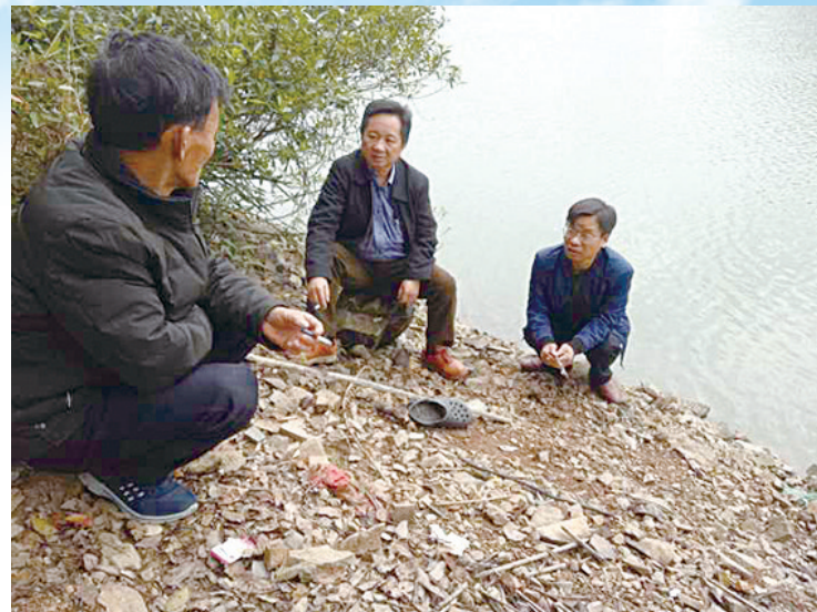
▲工作人员向渔民宣讲禁捕退捕政策

此外,去年茶陵县抓住上级政策机遇,及时包装项目,争取了中央禁捕退捕专项资金456.8万元。今年,县财政追加预算禁捕退捕专项配套资金200万元,为禁捕退捕工作提供了资金保障。该县还对退捕渔民均参加城镇职工养老保险或城乡居民养老保险。根据退捕渔民社保政策要求,采取先缴后补方式,给予渔民按各自情况给予15年社保补贴,最高达3400元/年。对持证专业渔民2户4人,该县还每人每月给予200元的生活过渡补助,补助两年。