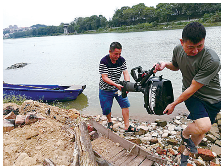
▲渔政工作人员拆除非法捕捞船