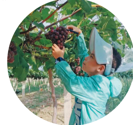
▲伟大农庄实景

如今,伟大集团将立足株洲,凭借独特“城乡一体化”的房地产开发经验,超前的市场观念和设计理念,把青龙岗小镇发展为全国连锁品牌,目前,伟大集团已在北京、雄安、上海、杭州、广州、三亚、贵阳、崑山等地完成战略布局,全国连锁发展战略已全面启动。