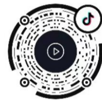
▲扫码看新闻 视频 剪辑 邓宇婕