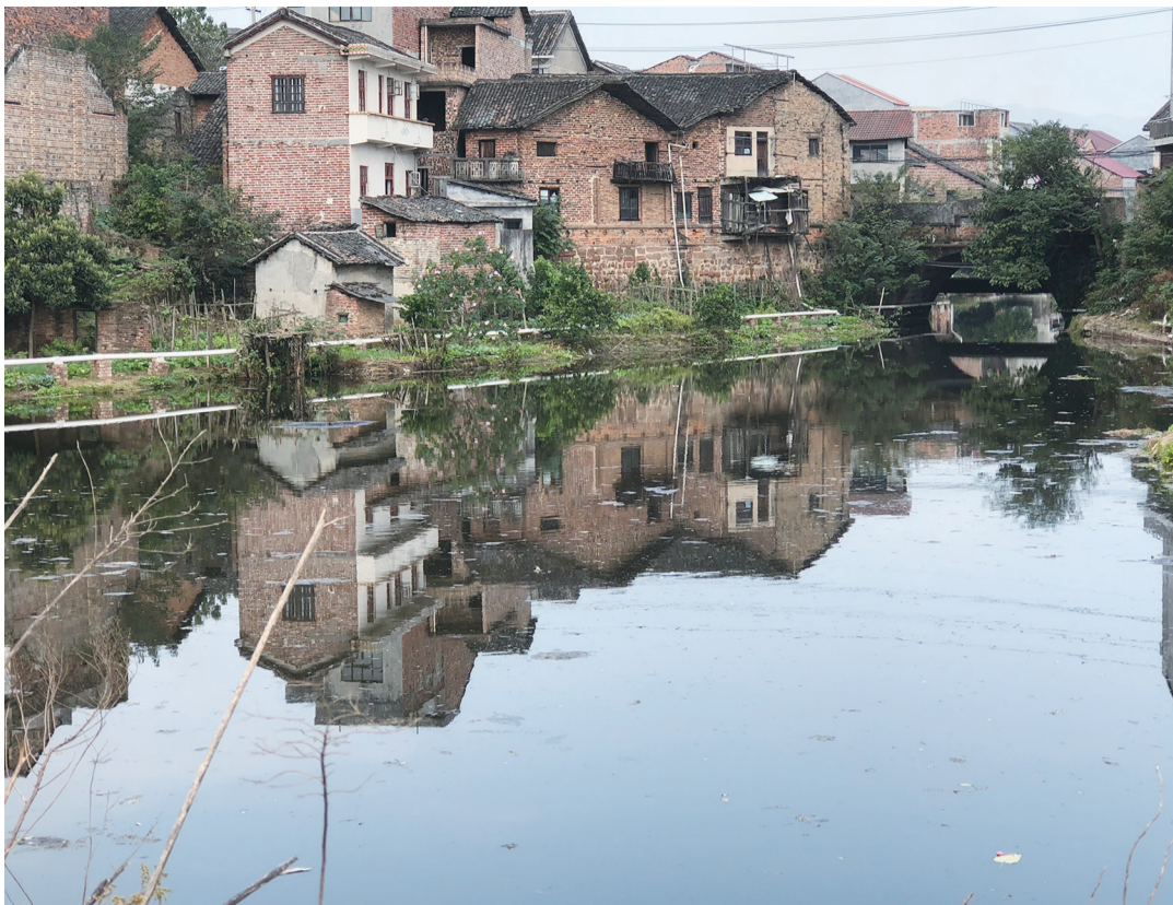
从河界看过去的三总桥