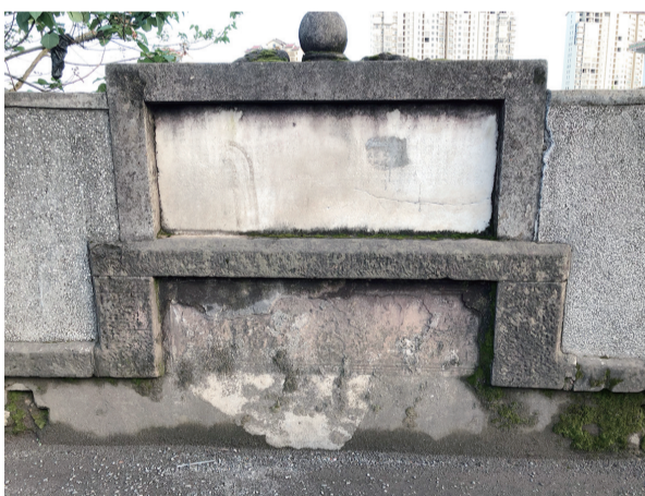
护栏上的石刻刻文