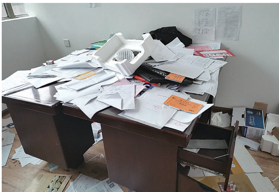
▲昨天,广木装修公司内一片狼藉