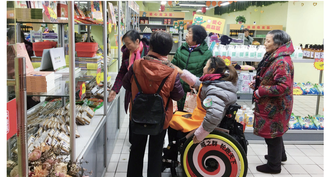
▲市民在慈善超市选购商品

记者看到,慈善超市位于中心广场家润多广场负一楼,分设有商品展示销售区和残疾人阅览、手工制作区两个部分。值得注意的是,店长和店员等5人均均为残障人士,负责超市经营。 “来看看,顺便买点生活用品,支持他们的工作。”采访中,一些市民正在此选购爱心商品,挤满了这家并不太大的超市。市民李女士表示,残疾人是社会的重要组成部分,这也是促进他们参与社会活动的好机会。 据了解,在这家超市里,其他残障人员、困难群众可以低价购买爱心商品,也可以一起进行手工活动、阅读休闲等。 芦淞区慈善会事务中心负责人介绍,芦淞区慈善超市就是为了搭建一个互助对接的平台。广大爱心人士和企业可以进行直接捐助,也可以将自己闲置的物品捐赠或者销售。超市设置了捐款箱,接收社会捐赠。捐赠物资由专人负责管理,登记在册,统一开具捐赠票据。 超市定于每月20日为捐赠日,每个月的第四个周末为欢乐集市日。物资接收及发放情况将每半年向社会公示一次,做到公开、公平、公正。 目前,该超市已募集到各类爱心商品1000多件,涉及书籍、手工制作、洗涤用品等各类物品。而这些爱心商品售后的营业利润,将用来帮助更多需要帮助的残疾人和困难人员。