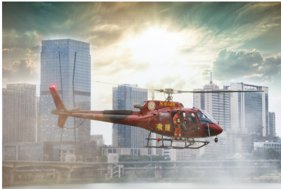
▲消防员在救援直升机上开展训练

本报讯(记者 刘玺 通讯员 陶广礼)记者从市消防救援支队获悉,市委、市政府办公室近日联合印发了《关于加强全市国家综合性消防救援队伍建设的指导意见》(以下简称“《指导意见》”)。未来五年,我市将新建、改建城市消防站12个,并建立水域救援、航空救援等各专业处置队伍。