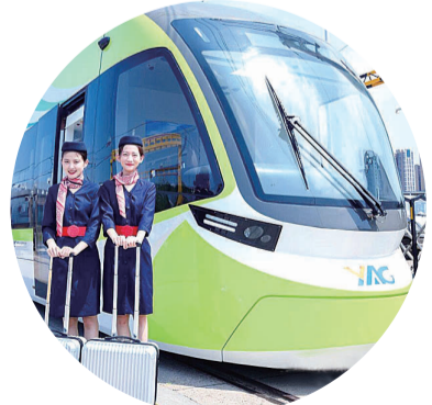
▲“绿海豚”有轨电车

本报讯(记者 伍靖雯)车头酷似海豚,流畅的车身线条搭配清新的苹果绿配色。日前,由中车株洲电力机车有限公司研制的“绿海豚”有轨电车顺利抵达昆明长水机场,即将开始服役。这也是国内首列采用自动驾驶模式的储能式有轨电车。 每列“绿海豚”为7组车厢编组,满员载客500人,采用高能型超级电容供电,可在旅客上下车的30秒内完成一次充电,单次30秒充电可运行5公里以上。 它既能节省人力,提高运行效率,满足机场全天运行需求,又能够减少人为操作的失误。针对机场线路个性化需求,整车采用100%低地板设计,客室内无台阶、无纵向斜坡,特别设置了大面积侧窗、较开阔的站立区,人性化行李架,方便乘客出行。 据了解,“绿海豚”有轨电车将在明年昆明长水国际机场S1卫星厅建成后投入使用。