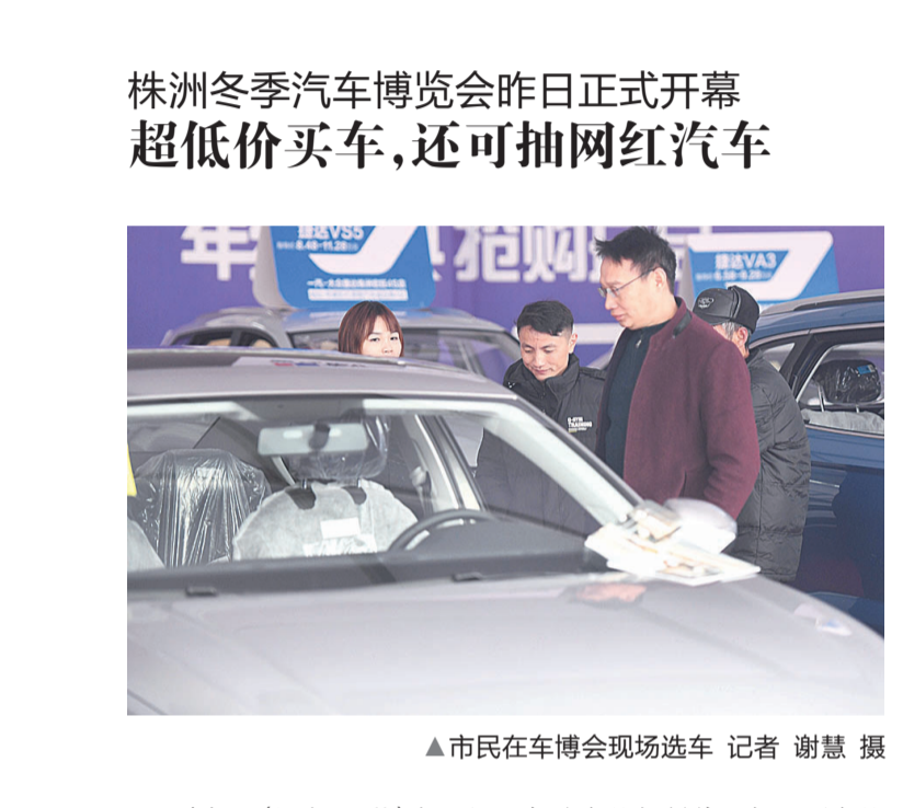
▲市民在车博会现场选车

本报讯(记者 周蒿 通讯员 刘川 刘禹)买房,最怕的就是出现资金风险。为加强商品房预售资金监管,保障商品房买卖双方合法权益,经多方征求意见,近日,市住建局印发了新修订的《株洲市新建商品房预售资金监管办法》(以下简称《办法》),从2021年1月1日执行。 对商品房预售资金全额监管 商品房预售资金是指开发商将其开发的商品房,在完成不动产首次登记前进行销售,由购房人按照合同约定支付的全部房价款,包括定金、首付款、分期付款、一次性付款、银行按揭贷款、住房公积金按揭贷款等。 根据《办法》,新建商品房预售资金监管遵循专户专存、专款专用、进度控制、无偿监管的原则,全部纳入监管范围,监管期限自核发《商品房预售许可证》起,一直到预售商品房办理不动产首次登记并解除监管为止。 “由开发商与监管机构、监管银行共同签订《监管协议》,一本《商品房预售许可证》只能设立一个监管账户。”市住建局相关负责人介绍,监管账户