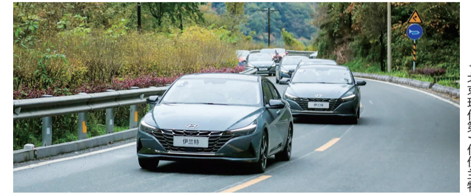
▲北京现代第7代伊兰特