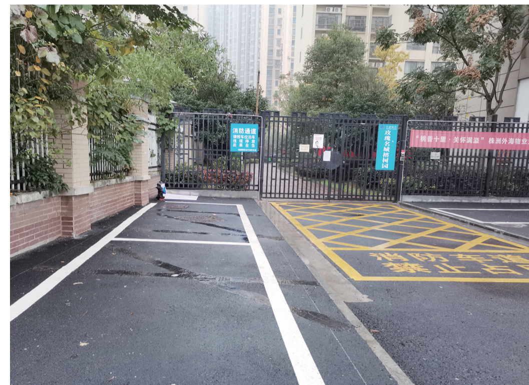
▲整改后的停车位,与消防通道平行

近日,荷塘区玫瑰名城有业主拨打晚报新闻热线28829110反映:我们小区有一部分公共区域被开发商划了停车位,而且有的停车位还占用消防通道。这些停车位是要收费的,我们业主意见很大。