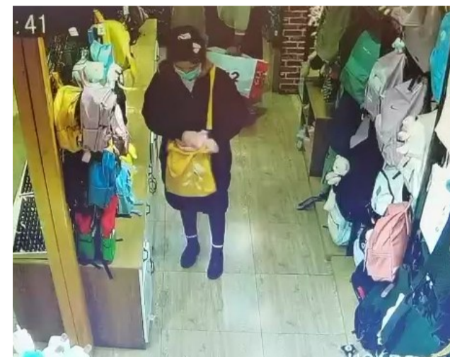
▲监控记录下小雨实施盗窃的过程

本报讯(记者 李卉 通讯员 魏天宇)因为一时贪念,如今面临刑事处罚,18岁少女小雨(化名)后悔不已。昨日,芦淞警方建宁派出所披露了一起让人唏嘘的盗窃案。