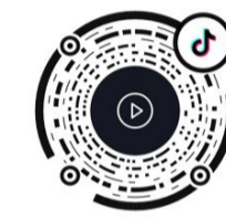
◀扫码看我市防艾主题宣传活动视频 剪辑:周姝曼