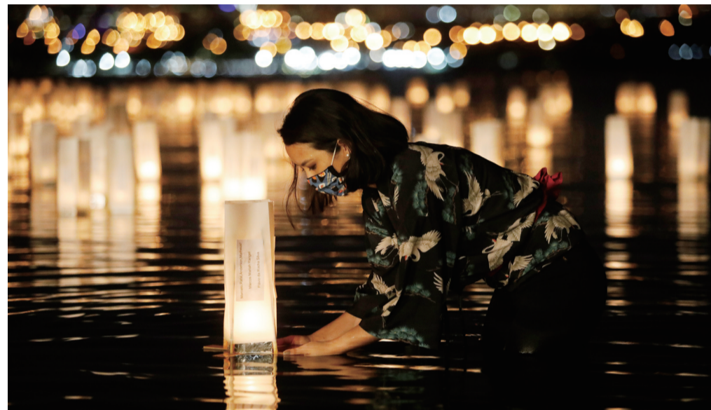
▲11月30日,在巴西首都巴西利亚,一名女子往湖中放入水灯

针对美财政部近日宣布因中国电子进出口有限公司支持委内瑞拉马杜罗政权而对其进行制裁,外交部发言人华春莹1日说,中委合作完全符合国际通行规则,不应被政治化、妖魔化。华春莹说,中国始终是网络安全的坚定维护者,主张信息通信技术应用于促进经济社会发展 and 人民福祉。美方的有关行径纯粹是炮制借口打压委内瑞拉和中国有关企业。“中方敦促美方遵守国际法和国际关系基本准则,以实际行动纠正错误,撤销各种名目的非法制裁。中方将采取必要措施维护本国企业正当权益。”(综合新华社报道)