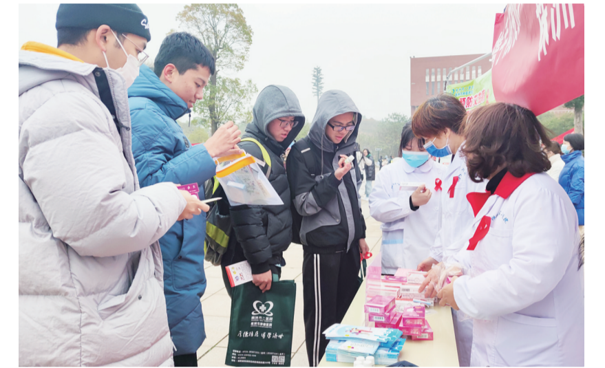
▲工作人员向大学生发放宣传艾滋病防治知识手册

目前,最常用的检测方法是抗体检测,抗体检测的窗口期一般为4-12周。建议在高危行为后4周检测抗体,如果4周结果阴性可以等到8周或12周再检测。一般情况下,如果12周之内没有再发生高危行为,也没有检测到抗体,就可以排除艾滋病感染。