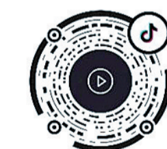
▲抖音扫码看相关视频