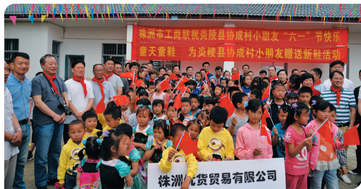
市工商联在炎陵县协成村开展捐赠活动

从2017年至2019年年底,“万企帮万村”行动中,株洲民企就业帮扶投入金额6000余万元,安置就业5820人次,组织技能培训5147人次。