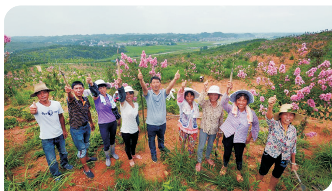
茶陵县万樟园林公司扶贫基地

点亮乡村,为全村新增131个太阳能路灯和98盏节能入户灯;修缮组道,为8个组硬化道路,拓宽修路组道1262米;修建水圳,为5个组修明渠和水管、水圳1506米,为2个组修建蓄水池并铺设饮水管道160多米;济困敬老,为95户贫困家庭送米送油送现金,为特困供养和独居老人送衣送裤送棉鞋,慰问困难党员,慰问90岁以上高龄老人。