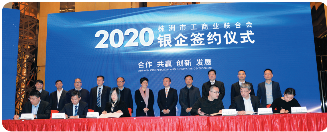
市工商联会员企业与银行签约

当好“助手”。针对民企融资难融资贵等难题,市工商联积极开展银企对接活动,联合司法机关建立民营企业维权机制,让民营企业感受到实实在在的温暖。