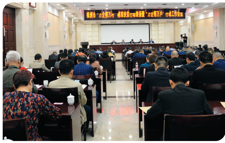
“万企帮万村”精准扶贫行动表彰暨“万企帮万户”行动工作会议