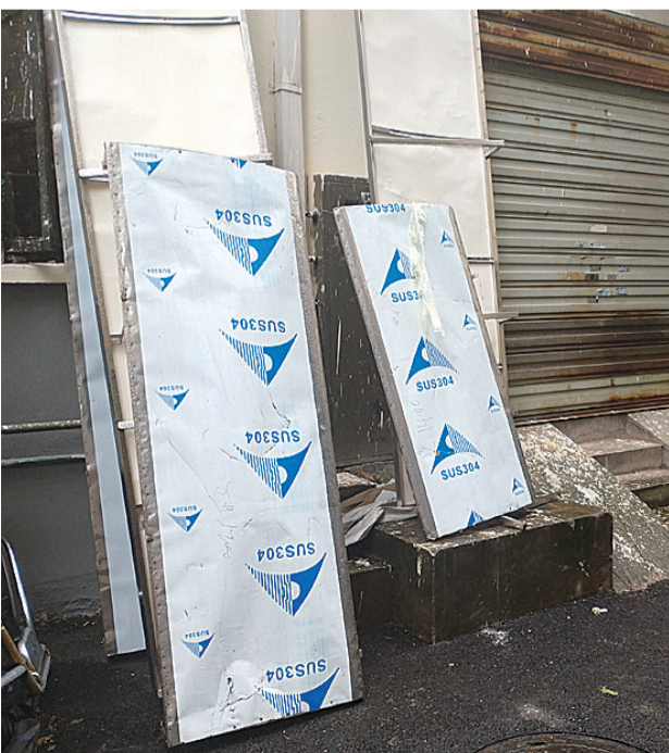
▲闲置在居民楼墙角的雨篷

至于居民反映的接缝问题,杨淼表示,目前大部分雨篷只是基本完成了固定,对接缝处密封打胶的工作正在进行中。雨篷全部安装完成后,区住建部门会安排专业的质检人员上门验收,所有安装不合格的雨篷都会及时进行修补或返工重装。