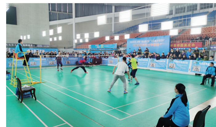
▲比赛现场

本报讯(记者 杨凌凌)11月29日,为期两天的第二届“全民健身场馆杯”长株潭民间羽毛球争霸赛在株洲落下帷幕,来自长沙的中南水球队获得本届民间球王争霸赛的冠军。本次比赛共吸引了长株潭三地38支代表队前来参加。赛事的举办,在株洲掀起了一股羽毛球热。