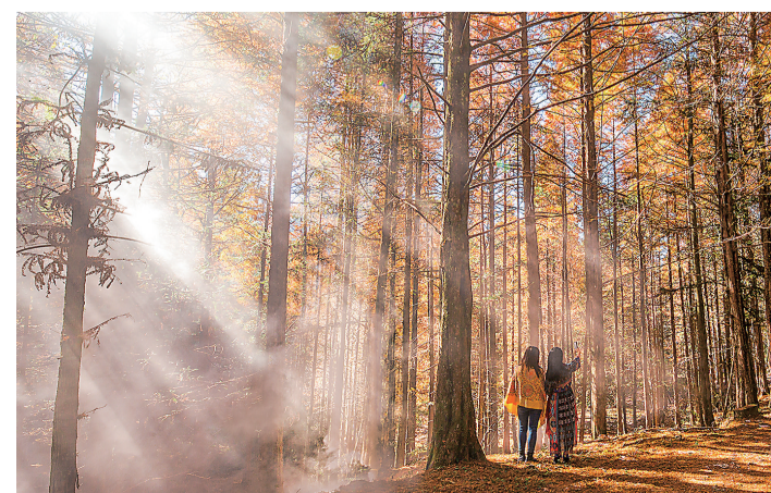
美女,阳光,薄雾,如同一幅漂亮的油画。