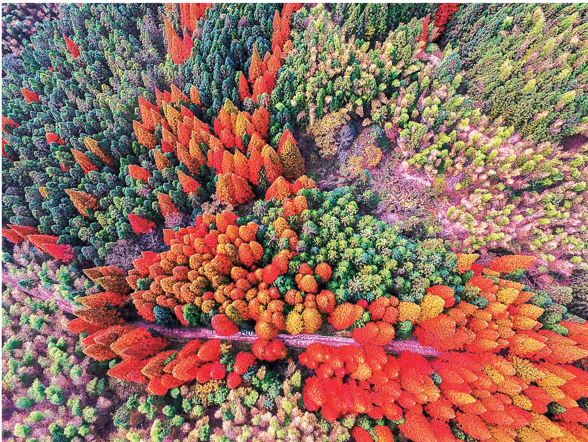
从上帝视角观看红杉林,就像大自然打翻了调色盘。

一阵风吹来,轻盈的叶子飘落下来,像一只只翩翩起舞的蝴蝶,地上是树叶铺就的一层厚厚的地毯,踩在上面便发出“咯吱咯吱”的响声。这响声,伴着不绝于耳的小溪淙淙的流水声,树荫深处空谷回音的啾啾鸟鸣声,就像是一曲美妙的盛秋交响乐。