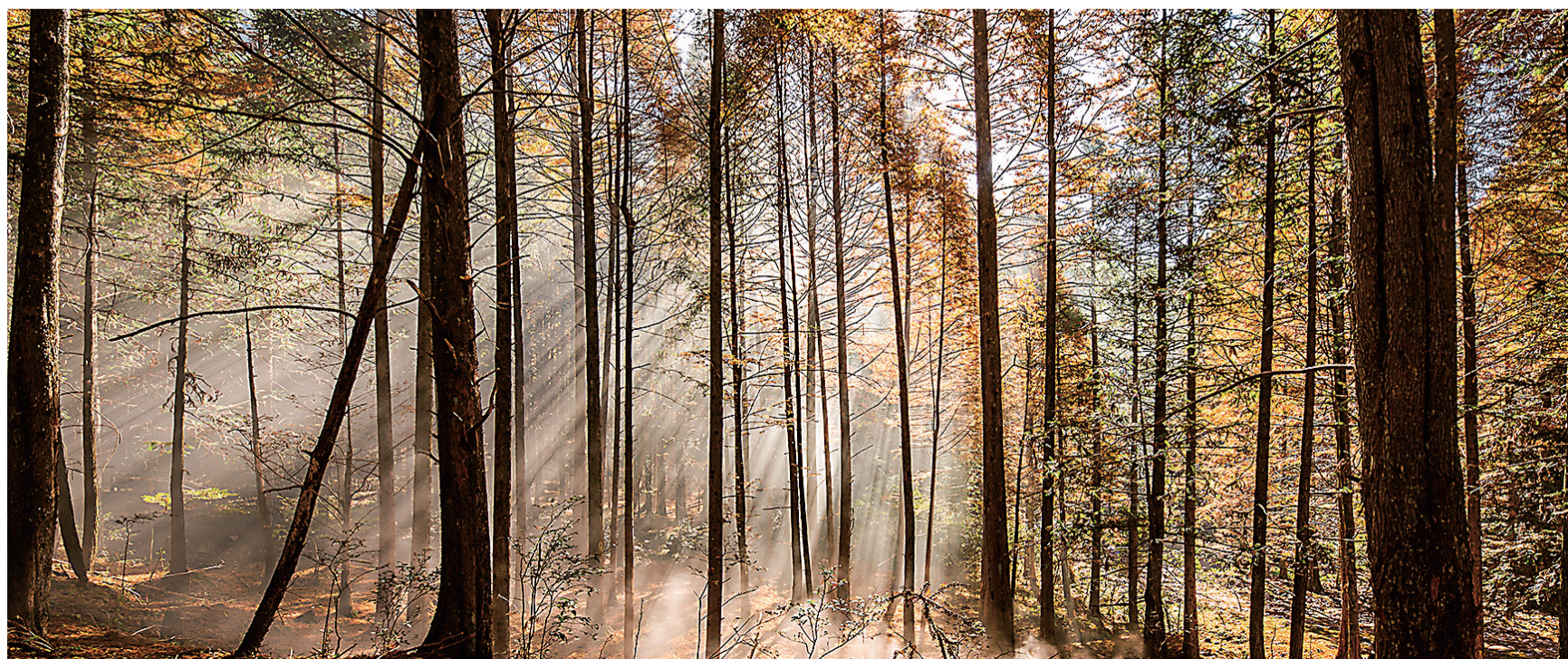
清晨的阳光透过晨雾犹如圣光一般。