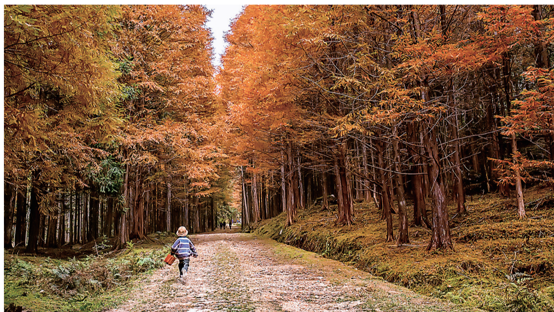
森林中的小精灵在欢快的撒野。