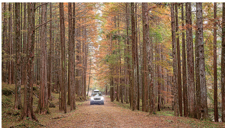
道路两边大树林立,路面铺满了黄叶。