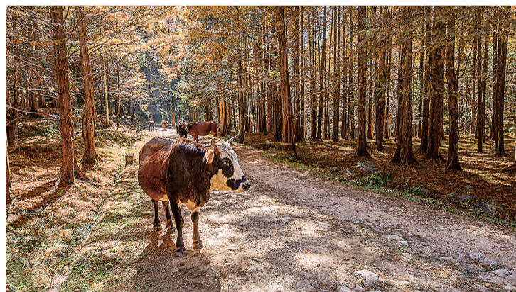
村民放养的黄牛也来凑热闹。