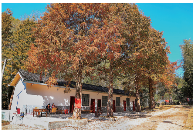
林场的办公房也变得如此多彩。